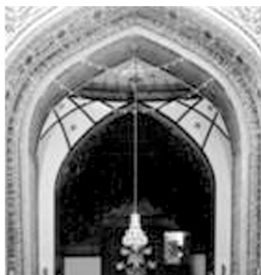
تصویر شماره ۲: کتیبه قرآنی، برنمای بیرونی دهانه ایوان ۵

دور تا دور صحن مسجد، کتیبه‌هایی به خط ثلث، مشتمل بر آیات سوره‌های «جمعه»، «حشر» و «بینه» مشاهده می‌شود؛ ۲ موضوع این آیات، توحید و تسبیح و تقدیس خداوند باری تعالی است؛ البته برخی از این آیات در شأن اهل بیت علیهم‌السلام نازل شده‌اند؛ چنان‌چه آیه هفتم سوره «بینه» مؤمنین پرهیزکار و نیکوکار را بهترین افراد می‌داند و بر اساس تفسیر این آیه، مراد از «خیرالبریه» علی علیه‌السلام می‌باشد؛ ابن عباس روایت می‌کند که این آیه، درباره امام علی و اهل بیت او علیهم‌السلام نازل شده است؛ طبق روایتی دیگر، این آیه در شأن علی علیه‌السلام و شیعیان ایشان است. ۳