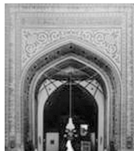
تصویر شماره ۱: کتیبه قرآنی، دور ایوان مقصوره ۴