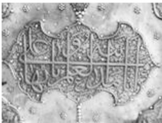
تصویر شماره ۱۳: کتیبه روایی، بالای در ورودی مدرسه چهارباغ ۶

من أراد أن ينظر إلى آدم في علمه والى نوح في فهمه والى ابراهيم في خلقه والى موسى في مناجاته والى عيسى في عبادته، فلينظر إلى علي بن ابي طالب. ۵