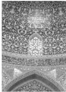
تصویر شماره ۹: کتیبه قرآنی، گنبدخانه جنوبی مسجد امام اصفهان ۲

می‌توان به کتیبه‌ای شامل «صلوات» و اسماء «الله، محمد و علی» اشاره کرد که با خط بنایی، زینت بخش گریوپوشش بیرونی گنبد این مسجد شده است.