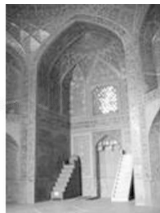
تصویر شماره ۱۲: کتیبه قرآنی، محراب مدرسه چهارباغ ۶

کتیبه ای نیز در همین مکان وجود دارد که شامل این روایت است: