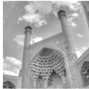
تصویر شماره ۸: کتیبه قرآنی، مناره‌های مسجد امام اصفهان ۱

در فضای داخلی گنبد مسجد امام، در ایوان جنوبی و زیر گنبد، کتیبه‌ای وجود دارد که از ابتدای ضلع غربی ایوان جنوبی آغاز شده و پس از ادامه یافتن در گرداگرد گنبدخانه، در ضلع شرقی ایوان به اتمام رسیده است. ۳ «این کتیبه که طولانی‌ترین کتیبه این مسجد است، حاوی پنج روایت است.» ۴ یکی از آنها، حدیث منزلت