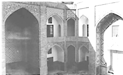
تصویر شماره ۵: نمایی از مدرسه پریزاد ۲

کتیبه دیگری که به خط ثلث و با گچ‌بری، زیر طاق ایوان جنوبی این مدرسه را مزین کرده است، مشتمل بر سوره «تین» است؛ موضوع این سوره، مسئله قیامت و پاداش اخروی است و خداوند این سوره را با چهار قسم آغاز می‌کند و خلقت انسان را شایسته‌ترین و نیکوترین می‌خواند. امام رضا علیه السلام درباره آیه اول سوره «تین» فرمودند: «مراد از تین، امام حسن علیه السلام و مقصود از زیتون، امام حسین علیه السلام می‌باشد.» ۱ در تفسیر آیات این سوره، منظور از «بلد امین» در آیه سوم: «وَهَذَا الْبَلَدِ الْأَمِينِ» پیامبر صَلَّى اللَّهُ عَلَيْهِ وَسَلَّمَ و منظور از «إِلَّا الَّذِينَ آمَنُوا وَعَمِلُوا الصَّالِحَاتِ» در آیه ششم، علی علیه السلام و شیعیان ایشان ذکر شده است. «هم چنین مراد از "دین" در آیه هفتم: «فَمَا يَكْذِبُكَ بَعْدُ بِالْدِينِ» ولایت امیرالمؤمنین علی علیه السلام می‌باشد.» ۲ از این رو، نگارش این سوره نیز می‌تواند نشانگر تمایلات شیعی هنرمندان تیموری محسوب شود.